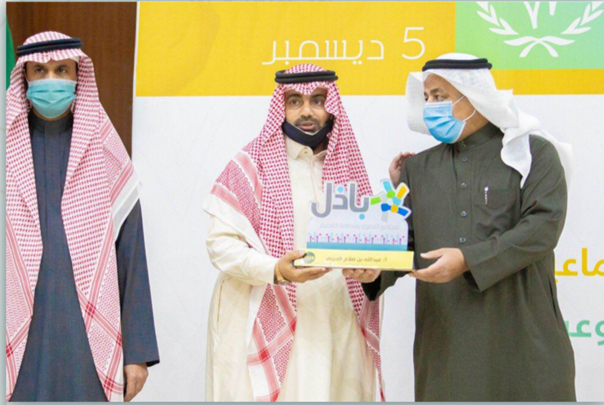
تكريم وحدة التطوع