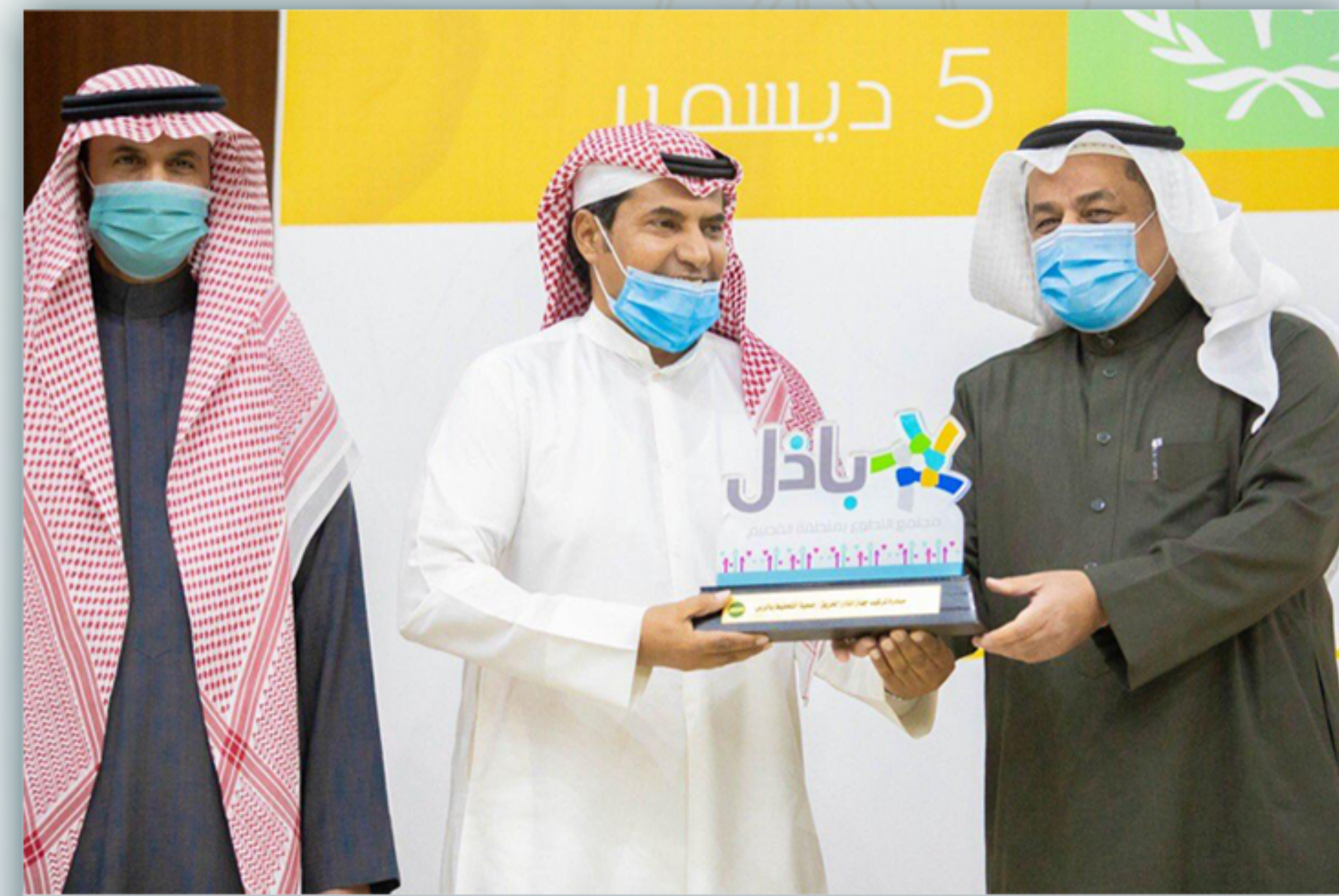
جائزة الفرص النوعية