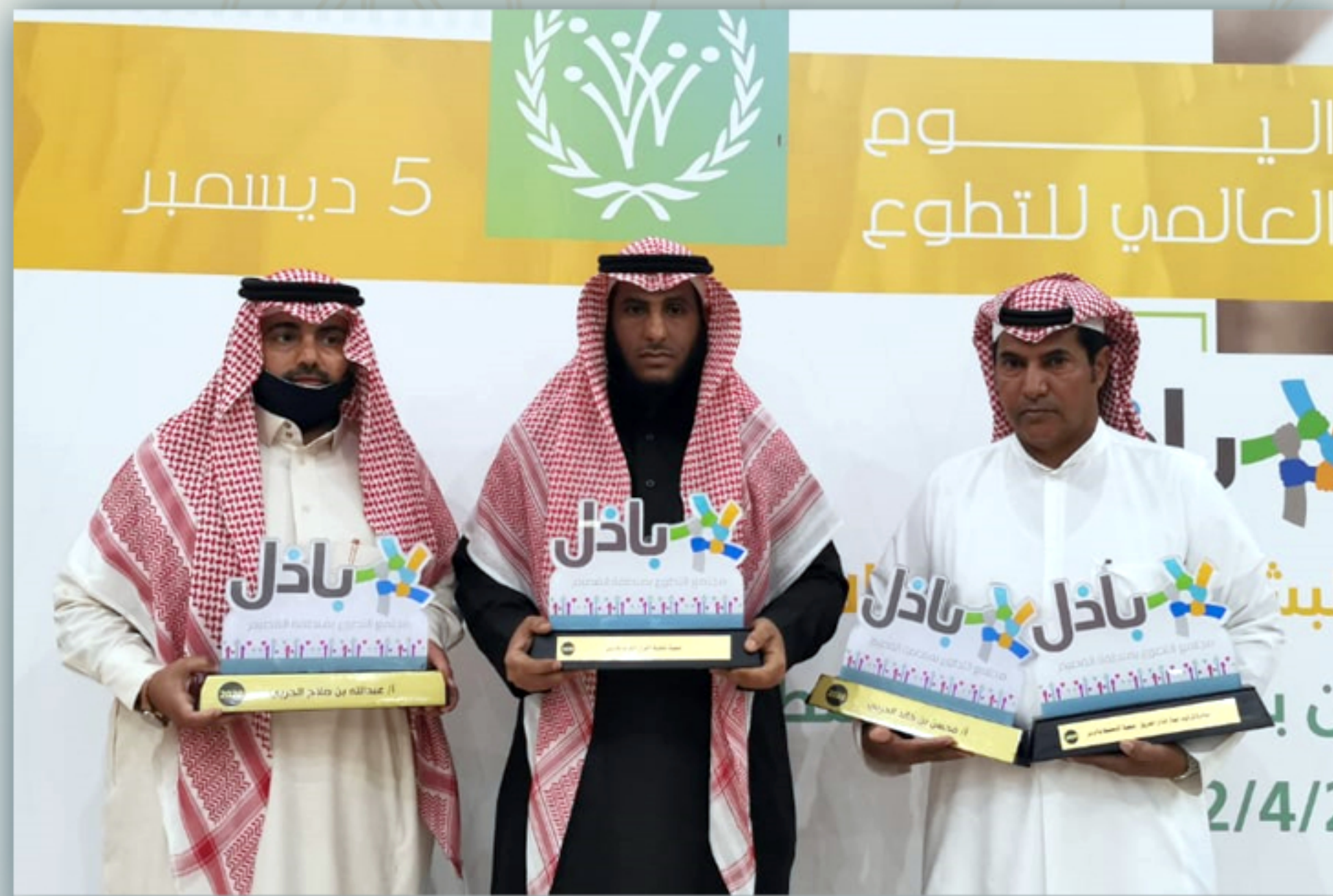
أكثر ساعة تطوع