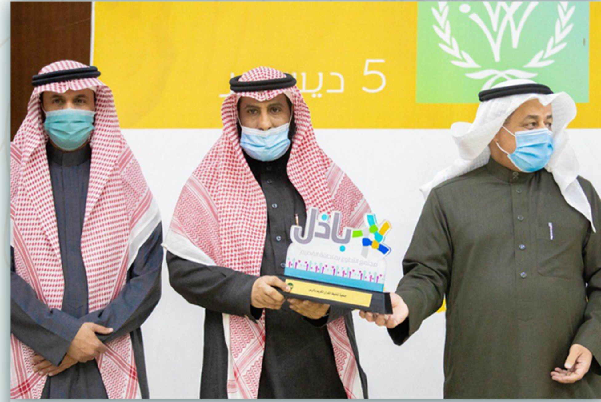
تكريم الجمعية للمشاركة